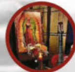
Music by Guadalupe Music Ministry

Free Admission for Men 18 to 25 Years of Age - Register through catholicmen.org