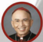
Bishop Brian Nunes Auxiliary Bishop San Gabriel Pastoral Region Archdiocese of Los Angeles

$30 - Includes Breakfast and Pizza Lunch